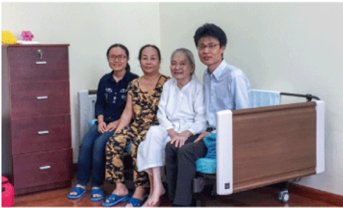
桜梅桃里の蔵垣内氏（右端）と入居者（右から2人目）＝ピンズオン省

介護サービスを手がける桜梅桃里（岡山市）が、昨年末にオープンした施設の入居者の増加に力を入れている。ベトナムでは近く高齢化が急速に進むとされるものの、介護の概念がほとんどないのが現状。施設の運営や人材育成を通じて、日本式の介護の文化を浸透させ「カイゴ」をベトナムの言葉として定着させることを目指す。